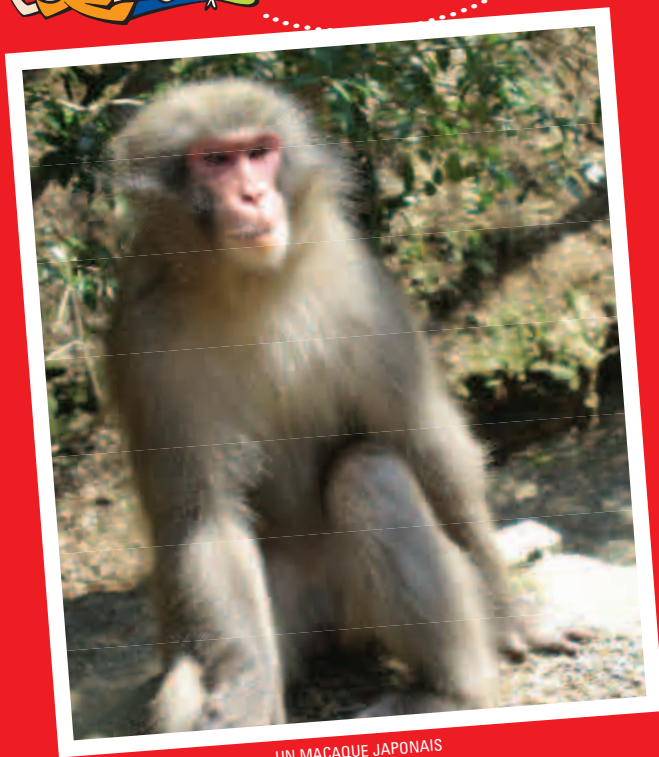
UN MACAQUE JAPONAIS